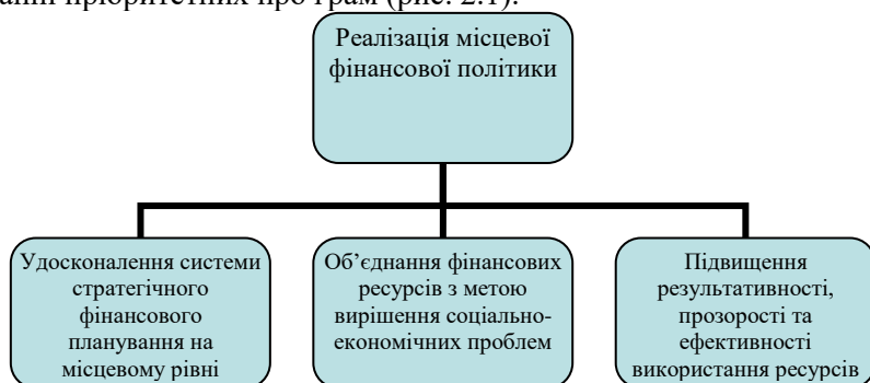
Рисунок 2.1 - Напрями реалізації місцевої фінансової політики в Україні

Основними напрямками реалізації місцевої фінансової політики є: удосконалення системи стратегічного фінансового планування з тим, щоб вона ґрунтувалася на об'єктивних критеріях; стимулювання до об'єднання на договірних засадах фінансових й інших ресурсів місцевих органів виконавчої влади та органів місцевого самоврядування для вирішення місцевих проблем; підвищення результативності використання ресурсів за рахунок їх концентрації на виконанні пріоритетних про грам (рис. 2.1).