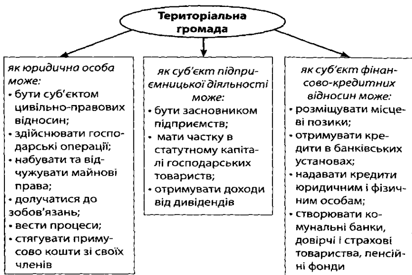
Рисунок 1.1- Права територіальної громади

Нині територіальні громади в Україні наділені правами юридичної особи, виступають суб'єктами підприємницької діяльності у сфері надання громадських послуг та суб'єктами фінансово-кредитних відносин (рис. 1.1).